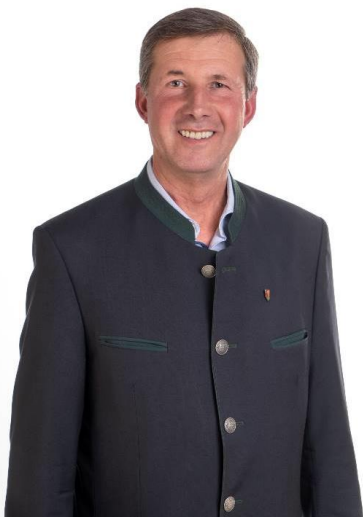
Roland Dietl Bürgermeister

Ich wünsche allen Strengberginnen und Strengbergern eine besinnliche Adventzeit, ein wunderschönes Weihnachtsfest und ein frohes neues Jahr 2020.