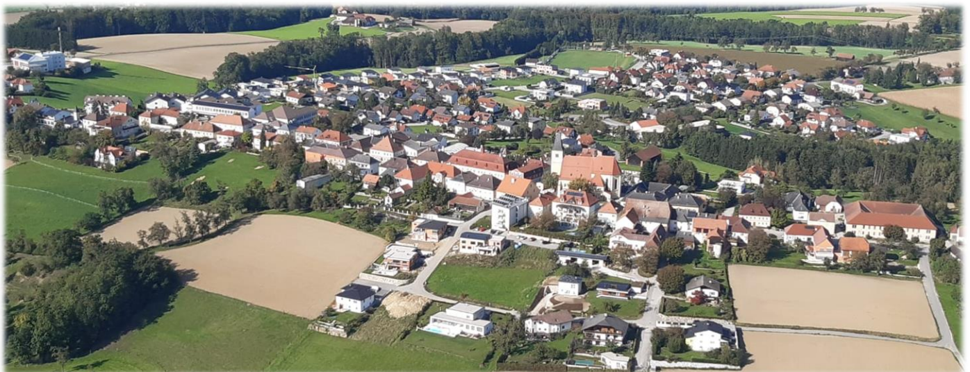
Lukas Schatzl Obmann Volkspartei Strengberg

Der von Rudi Carrell 1975 veröffentlichte Song „Wann wird’s mal wieder richtig Sommer? Ein Sommer wie er früher einmal war“ ist noch heute oft im Radio zu hören und scheinbar aktueller denn je. In diesem Sinne wünsche ich Ihnen einen erholsamen Urlaub sowie einen schönen Sommer 2021.